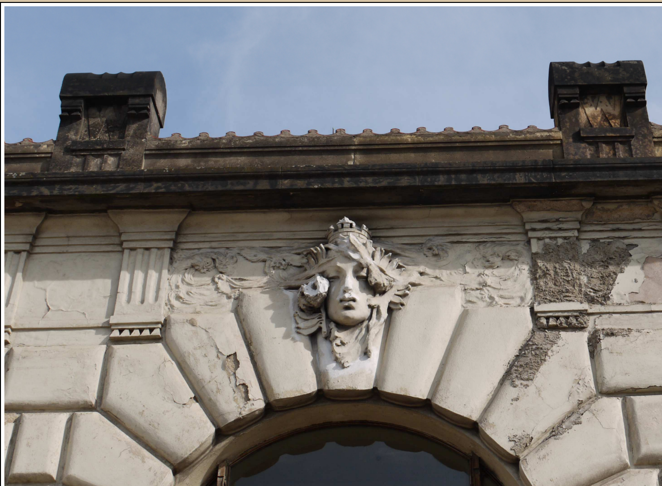
maskaron v klenáku okna stav v roce 2017