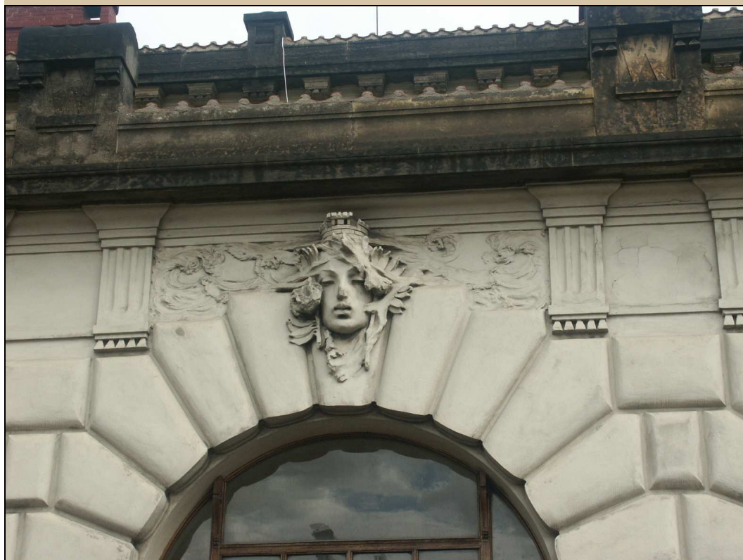
maskaron v klenáku okna stav v roce 2004